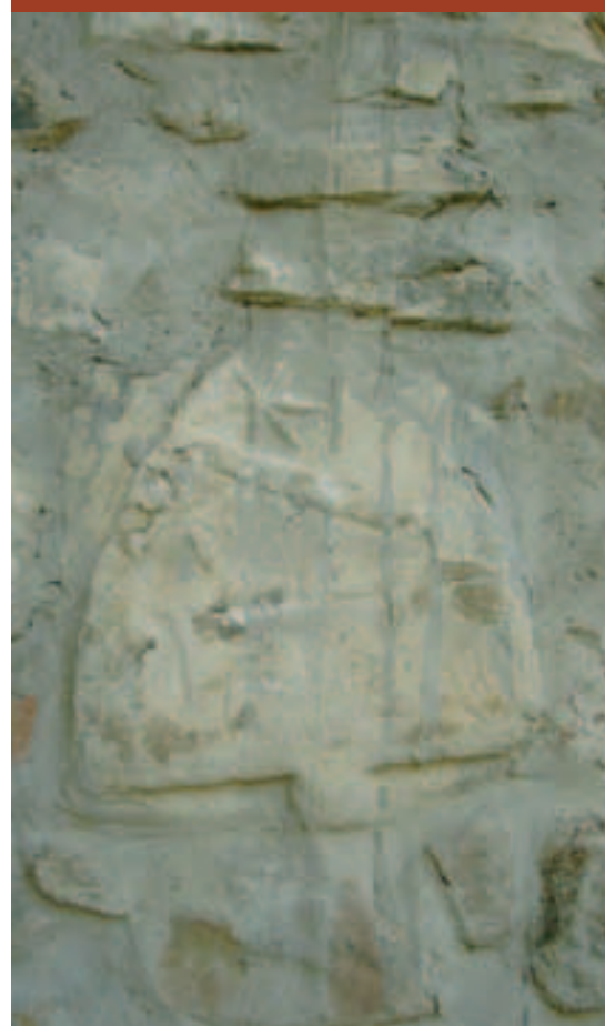
Vaglio di Basilicata (Pz). Stemma nobiliare tra le mura della chiesa di S. Pietro Apostolo