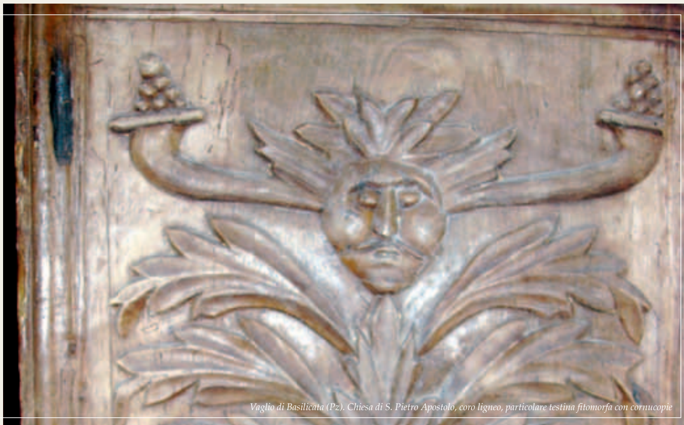
Vaglio di Basilicata (Pz). Chiesa di S. Pietro Apostolo, coro ligneo, particolare testina fitomorfa con cornucopie