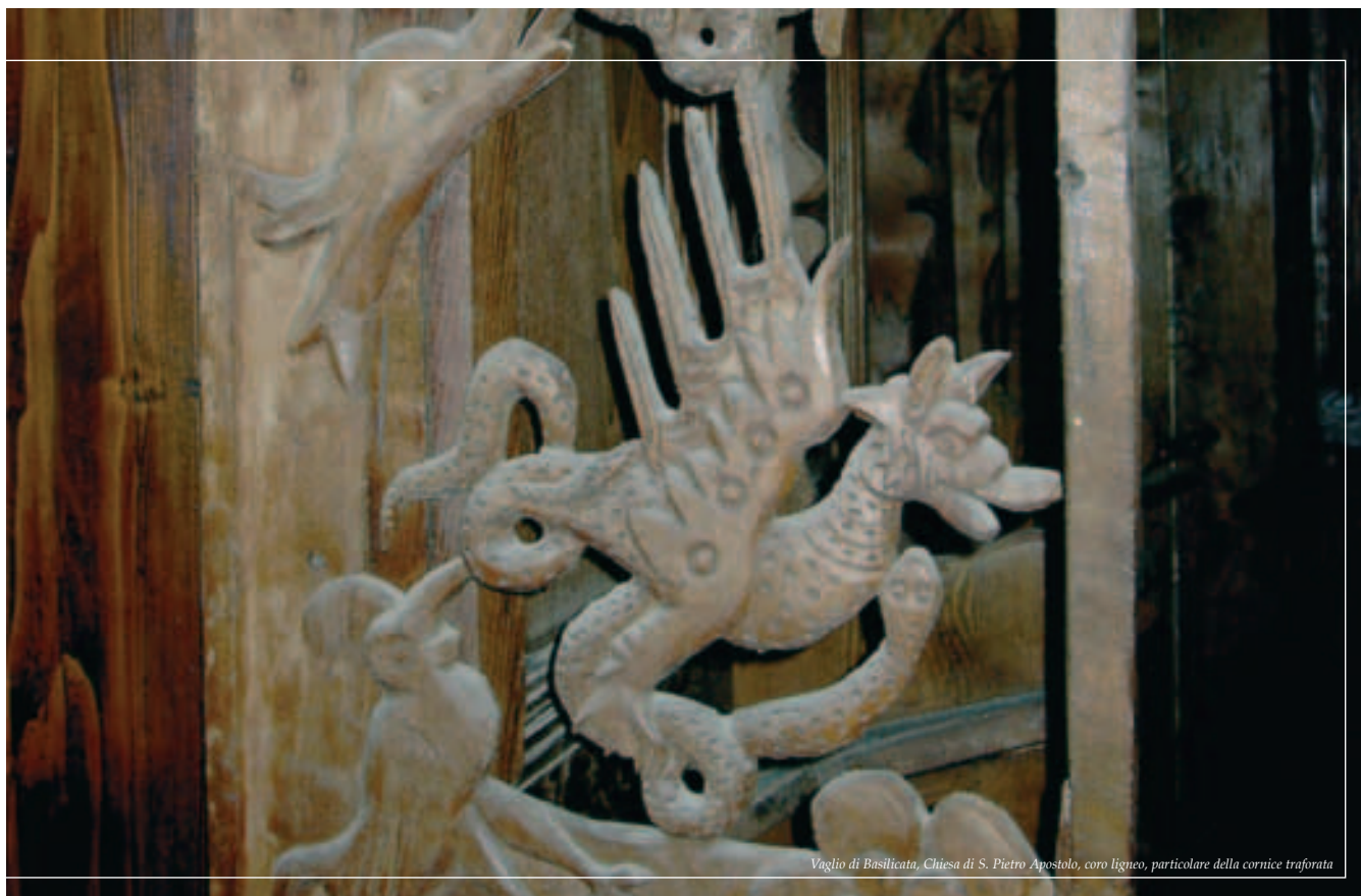
Vaglio di Basilicata, Chiesa di S. Pietro Apostolo, coro ligneo, particolare della cornice traforata