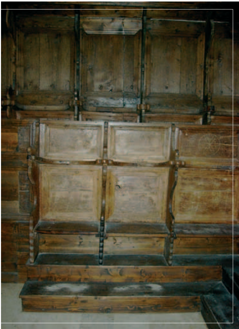
Vaglio di Basilicata (Pz). Chiesa di S. Pietro Apostolo, particolare di una parte del coro ligneo