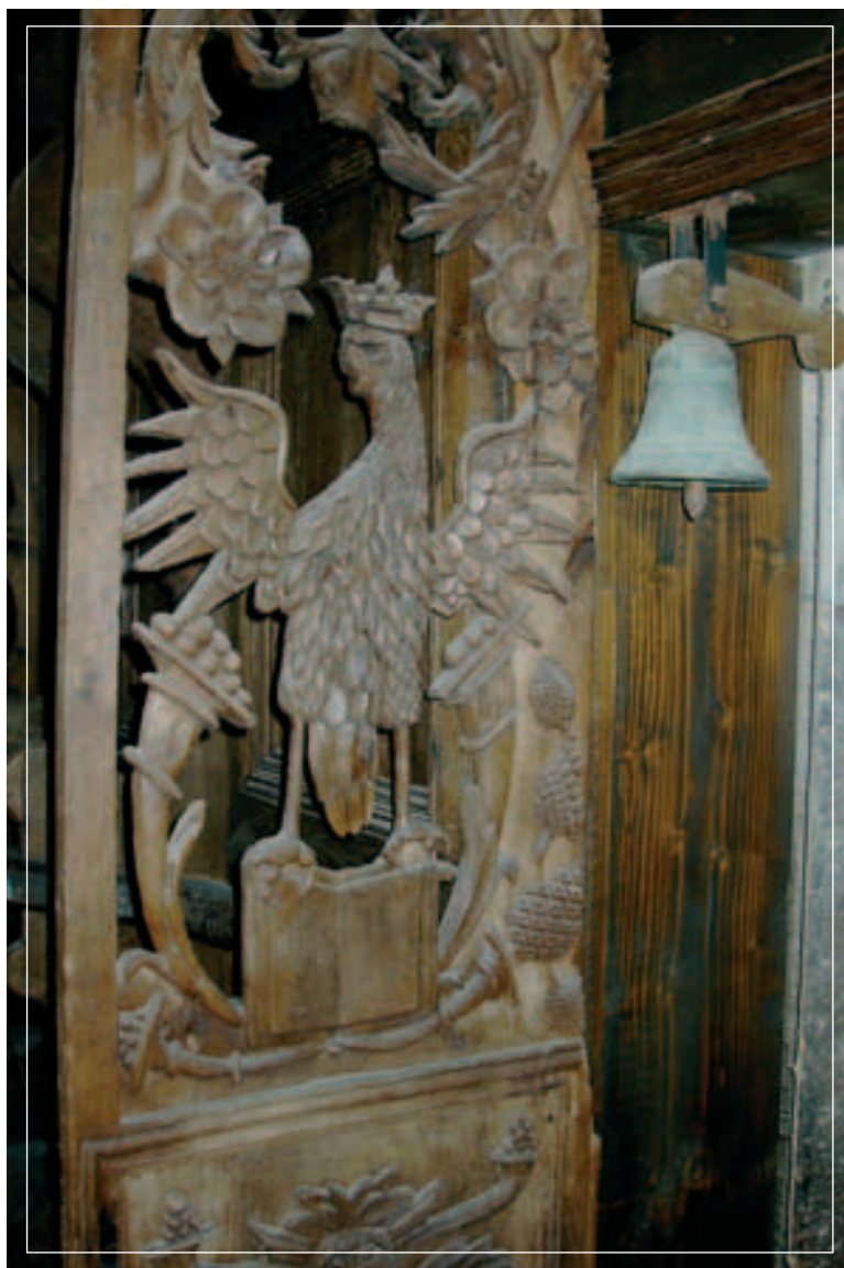
Vaglio di Basilicata (Pz). Chiesa di S. Pietro Apostolo, coro ligneo, figure a traforo della cornice

Diadora di Salazar o figliuola di don Alfonso Reggente di Cancelleria" andata in sposa al primogenito di Francesco Braida, premorto al padre Ettore, ci informano altri autori 6 . Il documento conservato presso l'Archivio di Stato di Potenza riguarda l'attestazione del trasferimento del luogo di sepoltura di Alfonso de Salazar e del figlio Antonio effettuato a Vaglio il 26 maggio 1618 all'interno della stessa chiesa madre di S. Pietro apostolo 7 .